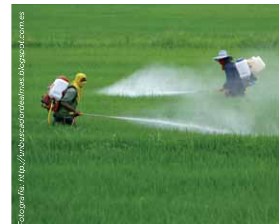
La soja es hoy en día un cultivo dominante en prácticamente toda América del Sur. Las frecuentes pulverizaciones fitosanitarias es, entre otras, una de las causas de mortandad o debilitamiento de colmenas. En la fotografía de la página anterior, captura de abejas melíferas en el cultivo de soja, para determinar el horario de pecoreo.

debajo de su potencial (Vaissière et al. , 2011). Queda claro entonces, que los impactos que esta transformación tiene para la sociedad en su conjunto y fundamentalmente para la región donde se concentra su producción, es materia de fuertes controversias. Fundamentalmente porque aún no se cuenta con una lectura holística, de los múltiples y complejos impactos que pudiera provocar sobre el territorio, aunque se acepta que estos cambios impactan de algún modo sobre la sociedad, su economía y el ambiente. Es nuestra intención aportar a esta lectura integradora pendiente, centrando el análisis en la estrecha relación existente entre producción agrícola y apícola y tomando como punto de partida algunos de los resultados científicos más relevantes alcanzados en los últimos años desde el laboratorio de Actuopalinología.